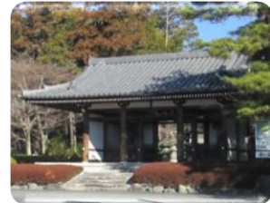
曹洞宗武陽山 能仁寺

割岩橋から上流に広がる河原は川遊びやバーベキューを楽しむ姿が多く見受けられ、春は桜、秋は紅葉の名所となっています。(奥は割岩橋)