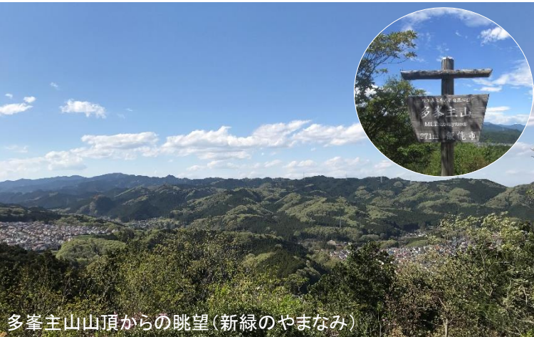
多峯主山山頂からの眺望（新緑のやまなみ）

飯能小町公園をスタートし、見返り坂、多峯主山、飯能・西武の森（ほほえみの丘）を歩き、飯能河原へ。コース途中の飯能・西武の森で植樹※をします。（※植樹はご希望の方のみ、お一組さま1本、先着100組さま。）どうぞ風光明媚な新緑の里山のハイキングをお楽しみください。ご参加お待ちしております。