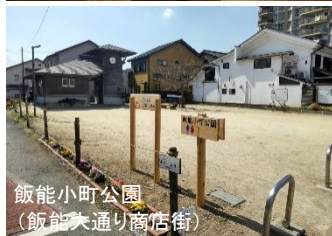
飯能小町公園 （飯能大通り商店街）