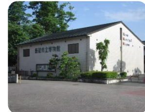
飯能市立博物館 (愛称: きつとす)

古くはこの上手に、雨をつかさどる神(祈雨・止雨の神)が祀っており、田畑の作物が枯れないように、ここに集まり神に雨乞いしたといいます。