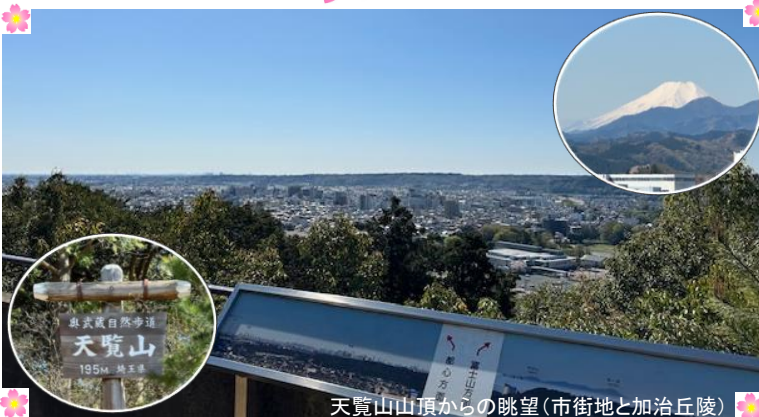
天覧山山頂からの眺望(市街地と加治丘陵)

飯能小町公園をスタートし、天覧山山頂、飯能・西武の森(ほほえみの丘)を歩き飯能河原へ。コース途中の飯能・西武の森で植樹※をします。(※植樹はご希望の方のみ、先着30組さま。) どうぞ風光明媚な里山の桜の名所と清流を楽しみながら春のあたたかな一日をお過ごしください。