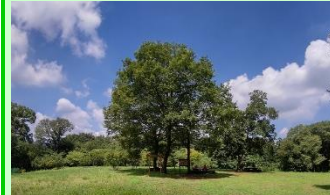
植樹地(ほほえみの丘)