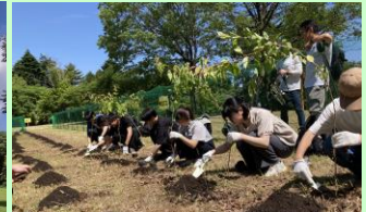
2024年5月の植樹イベント

植樹ご希望の方は、スタート受付時にスタッフにお申し出ください。「植樹券」を配布いたします。なお、植樹券の配布は先着30組さまとさせていただきます。