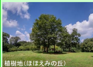
植樹地(ほほえみの丘)