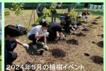
2024年5月の植樹イベント

植樹ご希望の方は、スタート受付時にスタッフにお申し出ください。「植樹券」を配布いたします。なお、植樹券の配布は先着30組さまとさせていただきます。