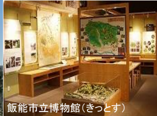
飯能市立博物館(きつとす)